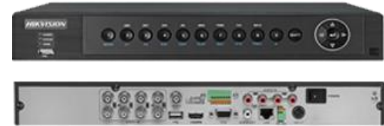
Digital Video Recorder