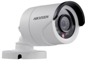
Bullet Coax Cam