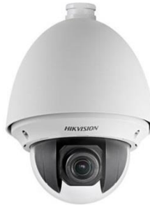
PTZ Coax Cam