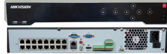
Network Video Recorder