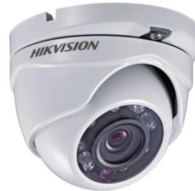
Dome Coax Cam